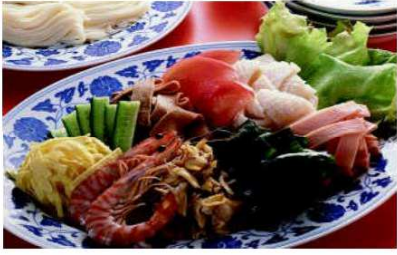
年間2000万トンの食糧が捨てられている!